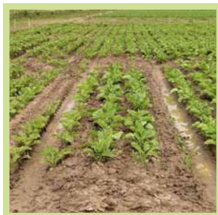
Danni sostenuti sulle carreggiate a seguito del numero di passaggi